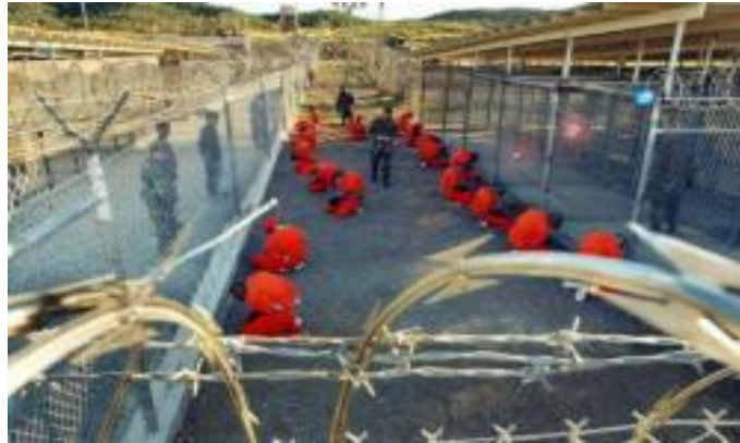
أمريكا تسلم ٣ معتقلين مصريين بجوانتانامو للقاهرة

ويكيليكس ١٢ :أمريكا تسلم ٣ مصريين بجوانتانامو للقاهرة بشرط ضمان المعاملة الإنسانية لهم