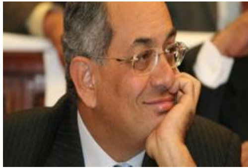
يوسف بطرس غالي

ويكيليكس ٦: سكوبي: المصريون ساخطون على غالي بسبب الضريبة لكنه يحظى بدعم مبارك