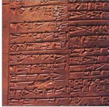
تاريخ أقدم الوصفات الطبية المكتوبة يرجع لعام ٢٠٠٠ ق.م. وتعتمد معظم هذه الوصفات على النباتات لعلاج الأمراض المختلفة.

يحتوي قرطاس مصري يرجع تاريخه لعام ١٥٥٠ ق.م. على أكثر من سبعمائة دواء. واستعمل قدماء الصينيين والرومان الكثير من الأدوية، ويُعدّ الرومان أول من قاموا بافتتاح صيدلية وكتابة أول وصفات طبية تحدد كمية كل مادة يحتوي عليها الدواء