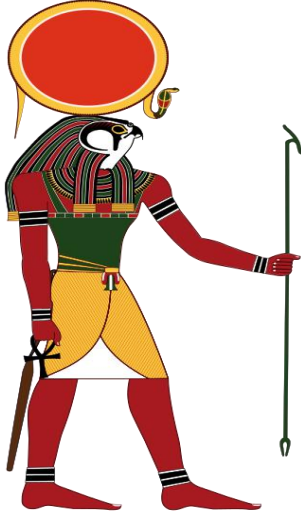
رع إله الشمس