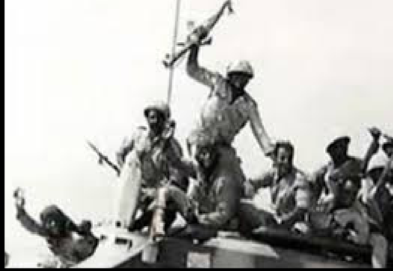
صورة مجموعة من الجنود الاحتفل بالنصر

خبرته ومشواره العسكرى، الذى استمر أكثر من 35 عامًا، وخطته في الحرب كلها أسباب جعلت مجلة الجيش الأمريكى تصنفه كواحد من ضمن أفضل 50 شخصية عسكرية عالمية أضافت للحرب تكتيكًا جديدًا. مما جعل الرئيس السادات يمنحه رتبة المشير، ليكون ثاني ضابط مصري يحصل على أرفع رتبة عسكرية بعد المشير عبد الحكيم عامر، كما حصل على نجمة سيناء من الطبقة الأولى وتم تعيينه نائبًا لرئيس الوزراء عام 1974.