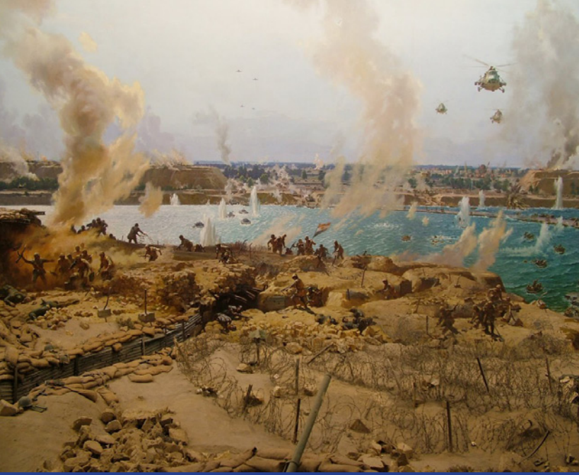
صورة تجسد حرب أكتوبر من بانورا أكتوبر القاهرة

وبإضافة طائرات التدريب يرتفع هذا العدد إلى 400 طائرة مروحيات القوة الجوية تتألف من 140 طائرة مروحية فيما تملك قوات الدفاع الجوي نحو 150 كتيبة صواريخ أرض-جو.